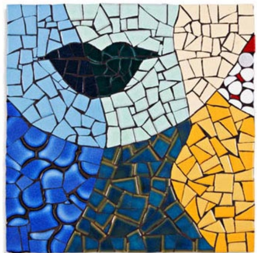
הפסיפס באדיבות: אודרי מאייר, אמנות פסיפס